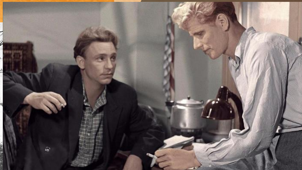
Кадр из фильма. 1956 г.

«Я не хочу судьбу иную. Мне ни на что не променять Ту заводскую проходную, Что в люди вывела меня...»